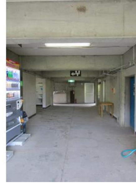
野外活動棟③ 薪置き場