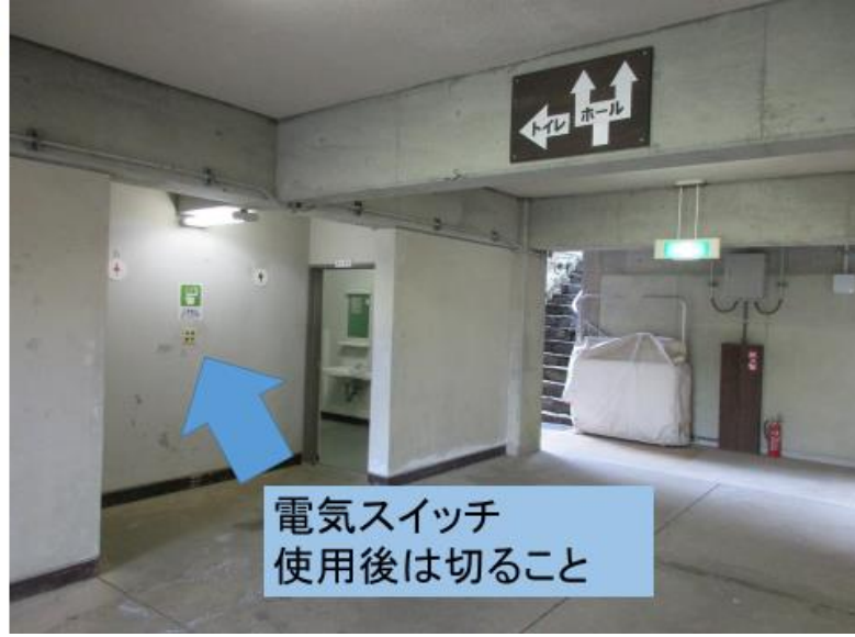
野外活動棟① トイレ