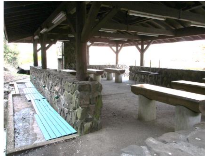
調理場内 ごみ分別バケツ