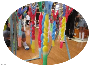
<キャンドルクラフト>