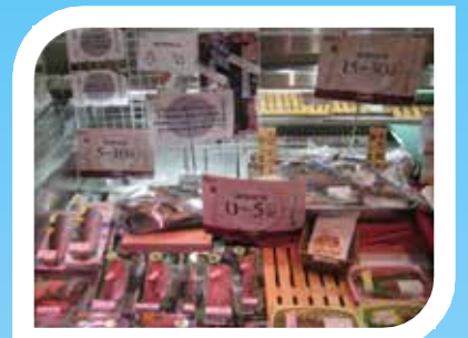
(2) 先進事例の東信水産(東京)

「豊かな海」とは生物が多様な海、 交流とにぎわいのある海、美しい海 のことであり、私たちも豊かな海の実 現を目指しています。