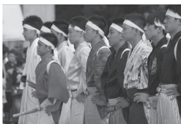
観一祭 デカンショ