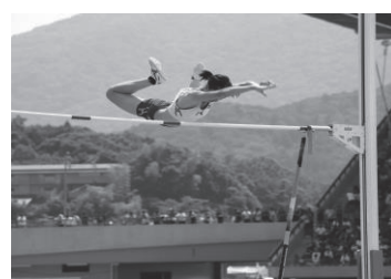
全国高校総体 女子棒高跳 優勝