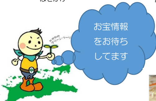
かがわのグリーン・ツーリズムキャラクター