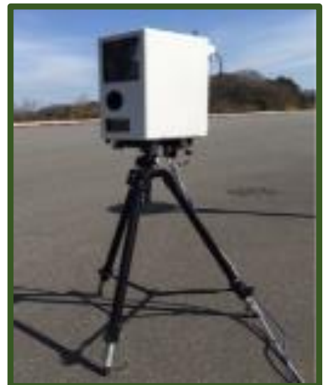
（可搬式速度違反自動取締装置）

平成31年2月1日から、通学路をはじめとする生活道路や、交通事故が多発している道路等において、可搬式速度違反自動取締装置（スピード違反を自動でカメラ撮影）を使用して速度違反取締りを行い、更なる交通事故抑止のため取締活動を強化します。