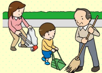
住民同士の信頼感や連帯感がみえる