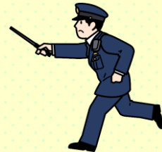
犯罪や交通事故 が起こらない

1日1日暮らしていく中で「あたりまえの幸せ」を誰かに作ってもらうのではなく、家族や地域の方々と手を取り合って自分自身で築きましょう。