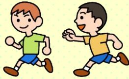
子どもの笑い声が 街中から聞こえてくる