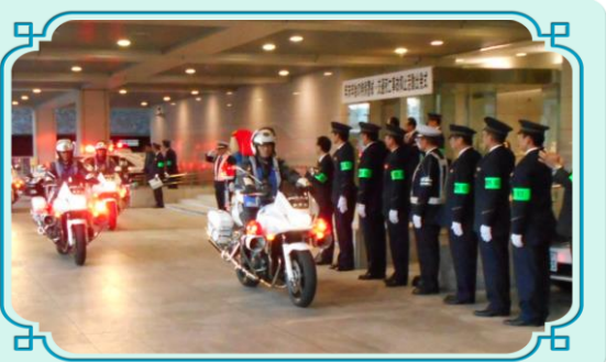
昨年の年末年始の特別警戒・交通死亡事故抑止活動出発式の様子