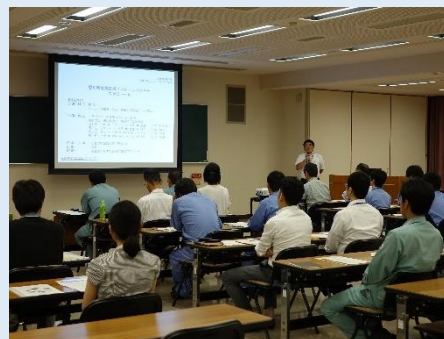
○全体での概要説明