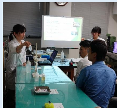
○HPLC を用いた食品中の成分分析のご紹介