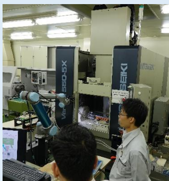
○スマートファクトリーの活用事例（協働ロボットの実演）のご紹介