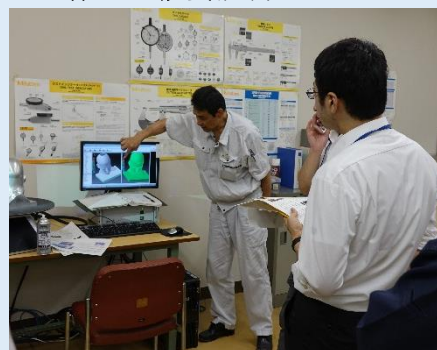
○3Dスキャナーによる非接触測定と形状検査のご紹介