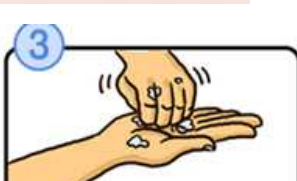
指先・爪の間を念入りにこすります。