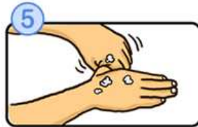
親指と手のひらをねじり洗います。