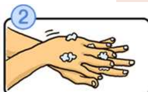
手の甲をのぼすようにこすります。