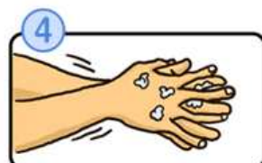
指の間を洗います。